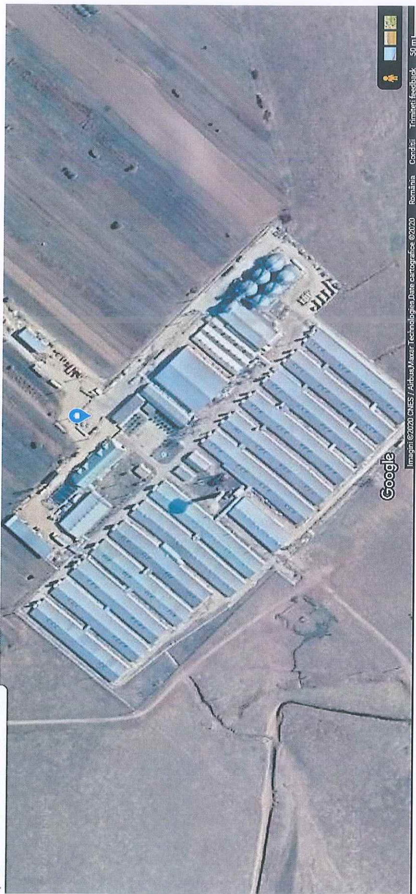
Titularul raportului : S.C. DANBRED ARGES SRL Plan de situatie cu halele de productie